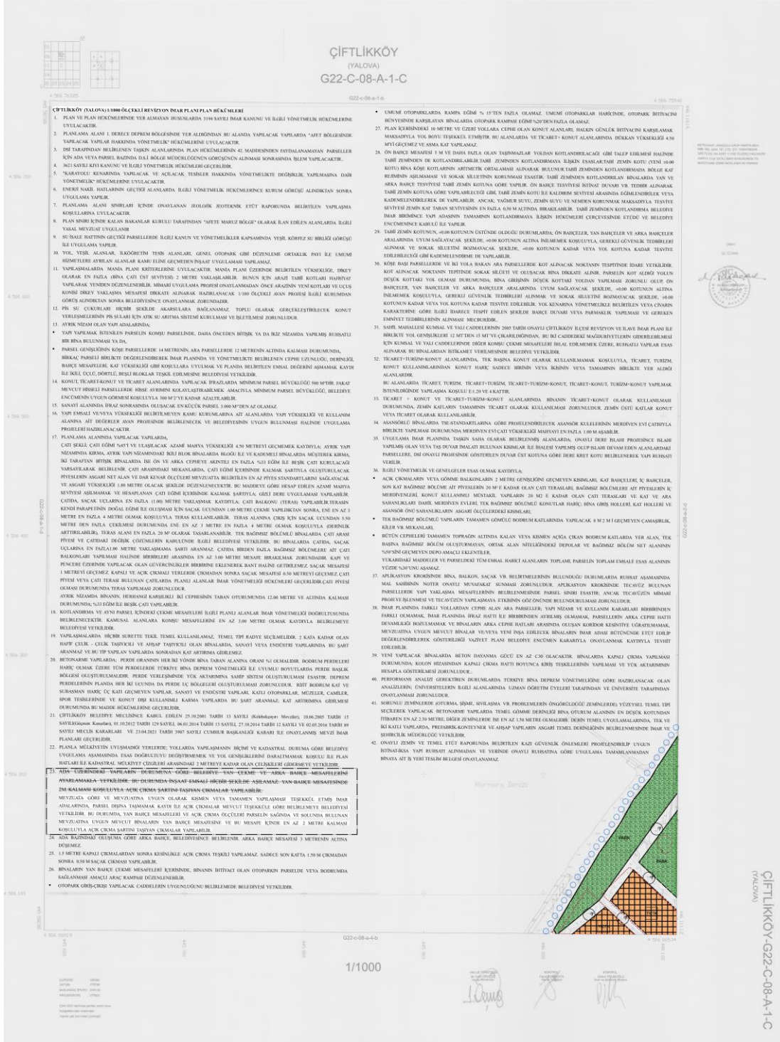
Resim 4: Yalova İli, Çiftlikköy İlçesi 1/1000 Ölçekli Revizyon Uygulama İmar Planı Hükümleri Değişikliği -1