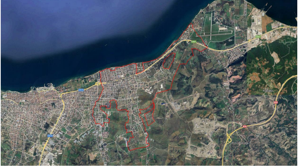
Resim 1: Yalova İli, Çiftlikköy İlçesi 1/1000 Ölçekli Revizyon Uygulama İmar Planı Sınırlarına İlişkin Uydur Görüntüsü

1/1000 Ölçekli Uygulama İmar Planı Hükümleri İlavesi/Değişikliği; Yalova İli, Çiftlikköy İlçe sınırları dâhilinde kalan alanları ilgilendiren Yalova İli, Çiftlikköy İlçesi 1/1000 Ölçekli Revizyon Uygulama İmar Planı Plan Hükümleri ile ilgili olarak hazırlanmıştır.